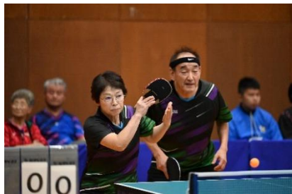
スポーツ交流大会 (卓球)