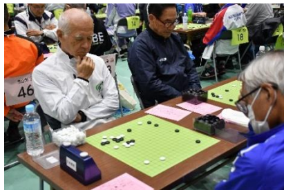
文化交流大会 (囲碁)